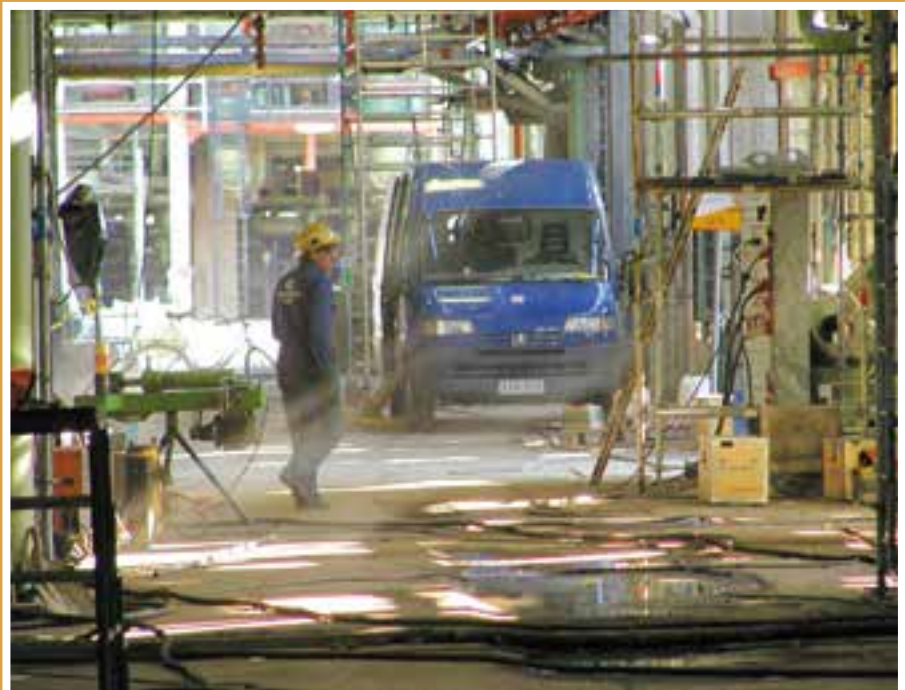
Ennen oli ennen.

Noin 35 vuotta sitten Pekeman Työntekijät ry:n eräs aloitteista koski työehtosopimusten tulkin- ta-etuoikeuden siirtämistä työnantajilta työntekijäpuolelle. Olisiko aika ottaa aloite uudelleen käsitte- lyyn?