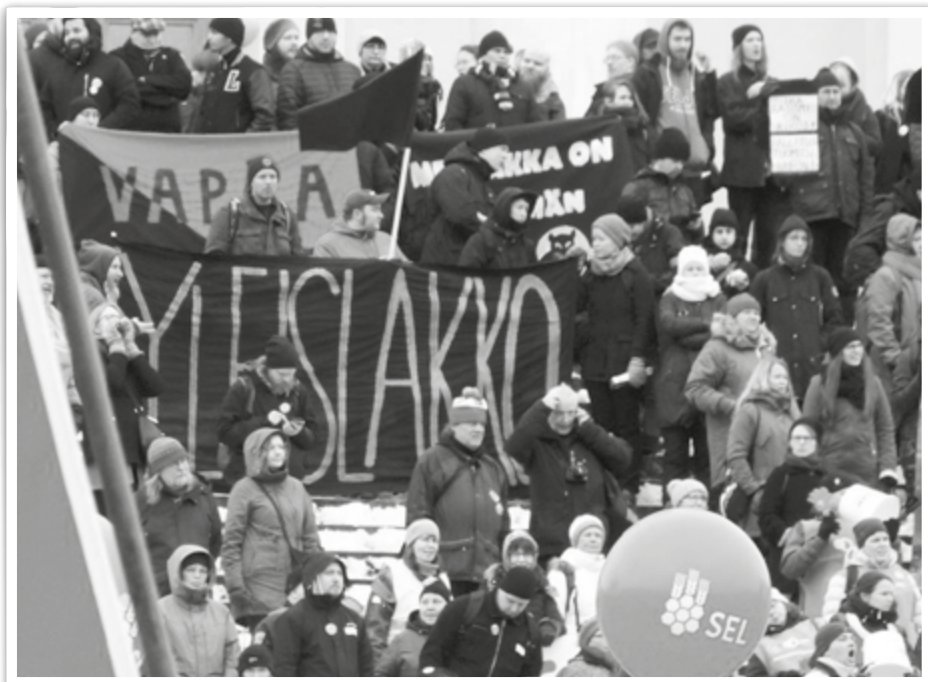
Jäsenistöllä oli odotuksia talven 2018 suurmielenosoituksessa