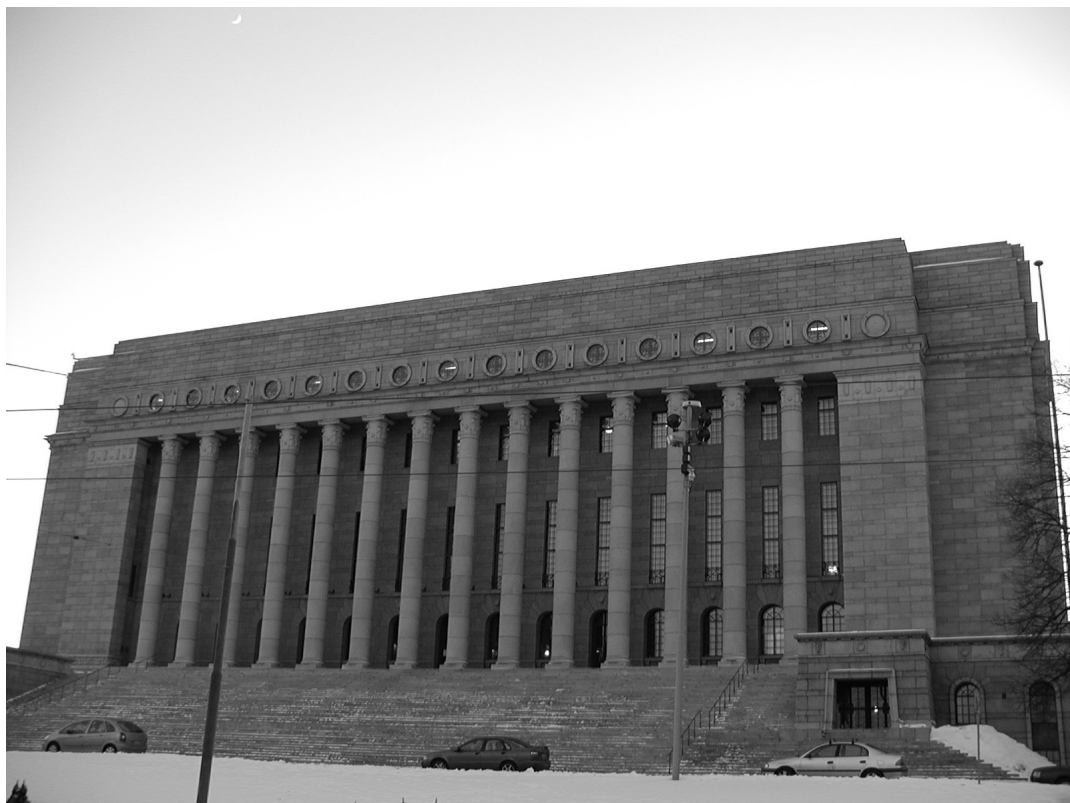
Maamme hallitus puraisee köyhän toimeentulosta lähes kaiken, mitä vain voi puraista. Ministereillä riittää vielä joulukinkkujenkin jälkeen pureskeltavaa, sillä ammattiyhdistysliikkeellä on vielä sanansa sanottavana hallituksen suunnitteleminen työelämä - ja sosiaaliturvaheikkyyksien suhteen.

Pulse Check vastausprosentti oli erinomainen. Kertoo siitä, että henkilöstöä kiinnostaa työyhteisön