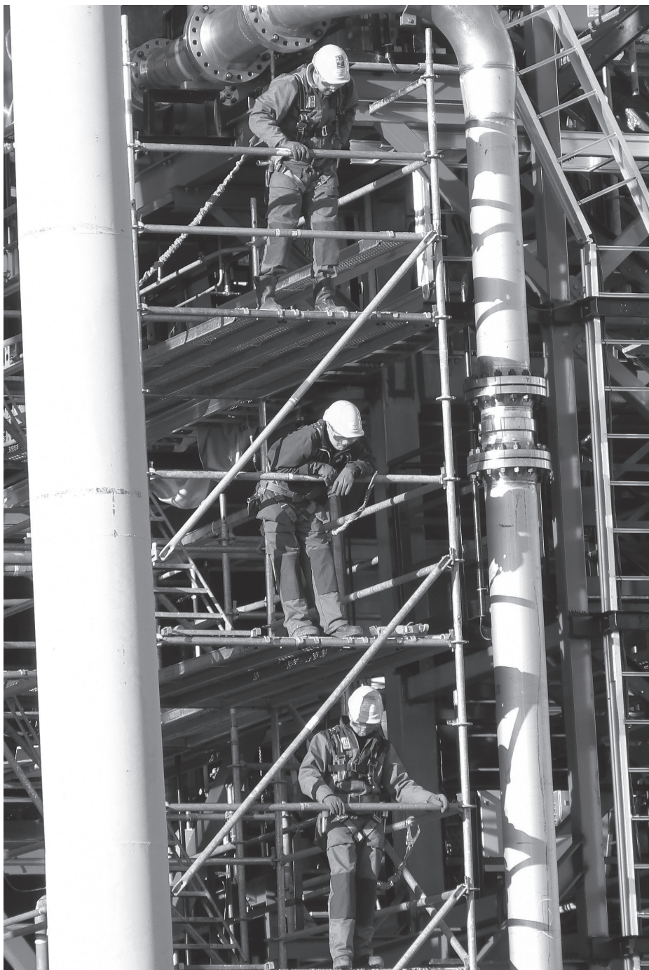
Historian havinaa. Arkistokuva.