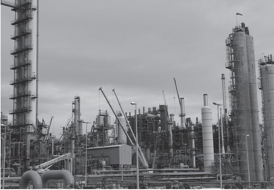
Taas riittää tulevana syksynä työmaalla vilinää ja vilskettä. Arkistokuva.

Täällä Pekeman työntekijöissä ollaan kyllä jo henkisesti varauduttu mahdollisiin vaikeisiin aikoihin. Ammattiosastossa ja liitossa tehdään, sitten tarvittavia toimia aina kulloisenkin tilanteen mukaan. Edetään päivä kerrallaan.