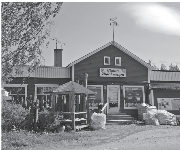
Kyläkaupoille tuki on käynyt välttämättömäksi suurten keskittymien seurauksena.

Kilpailu on kuvassa mukana siinä kohtaa, kun keskusliike ostaa tuotteita tuottajilta ja maahantuojilta. Vain halvimmalla myyvät suuret tuottajat saavat tavaransa kauppoihin. Ne ovat paljolti samoja tuottajia, jotka nauttivat verovaroista EU-tukina. Kilpailu toimii siten, että se syö pois pienet ja paikalliset toimijat. Silloin kokonaistyöpaikat vähenevät, jonka veronmaksajat eli kuluttajat maksavat. Kilpailu alentaa näennäisesti hintoja, mutta nostaa yhteiskunnallisesti kunkin meistä kuluja.