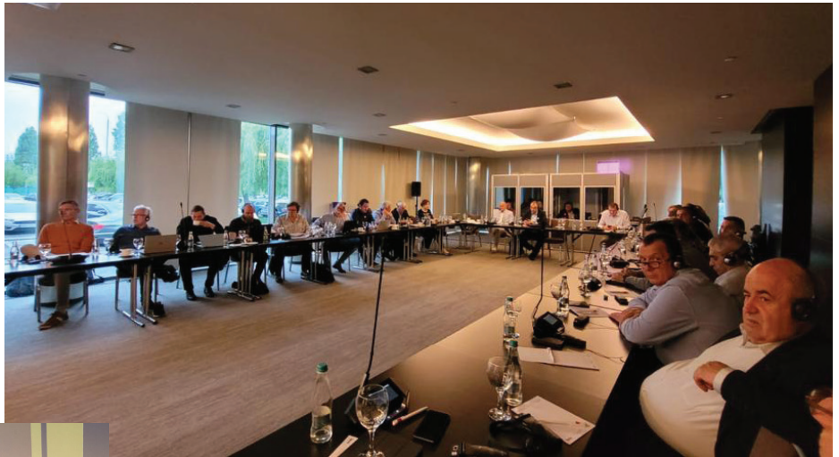
EWC:n ensimmäinen varsinainen kokous.