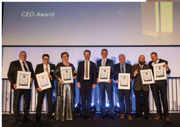
Podiumilla palkintoa blokkaamassa.

Uusi EWC kokoontui ensimmäiseen varsinaiseen kokoukseen 4.5. Bukarestissa Romaniassa. Kokous hoidettiin reaaliaikaisella tulkkauksella (englanti-saksa-romania), jonka vuoksi kokouksen dynamiikka oli luonnollisesti aika tahmeaa verrattuna esimerkiksi CCC:hen, missä kaikki pystyvät kommunikoimaan englanniksi.