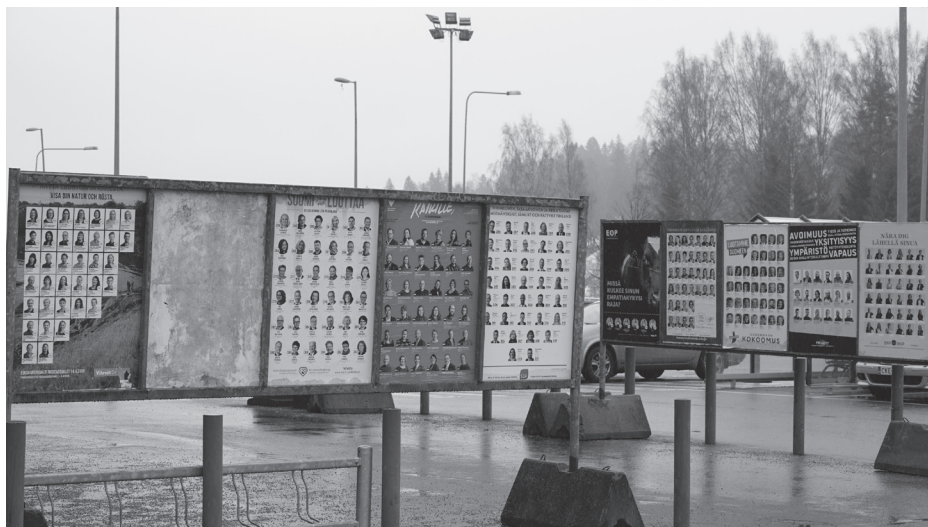
Vaalimainokset ilmestyvät katukuvaan.

Itselläni vedenjakajan muodostaa nyt se, kuka vetää Suomea kohti rauhanomaista politiikkaa. Olemme maksaneet sen verran ison kasan veroja, että meillä on oikeus parempaan ulkopoliittikkaan. Jos se hoide-