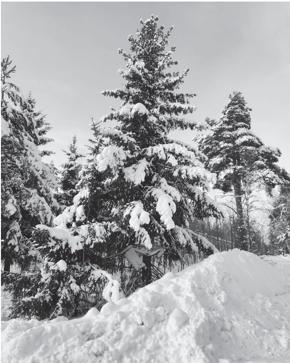
Kaikki tämä lumi saapui yhdessä vuorokaudessa.

Yhtiön joululahja on saanut jälleen hyvän vastaanoton. Kiitos yhtiölle laadukkaasta ja ilahduttaneesta joululahjasta ja joululahjatyöryhmälle laadukkaasta työstä lahjan