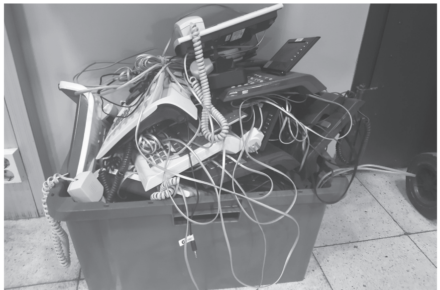
Esimerkki yli 100% suorituksesta.

Kysyin itse flunssan kourissa eräältä ystävältäni vinkkiä, mitä eliksiiriä minun tulisi valmistaa saadakseni vuotavan nokkani aisoihin.