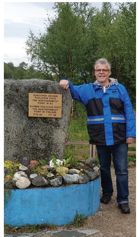
EU:n pohjoisin rajapyykki saavutettu Nuorgamissa.