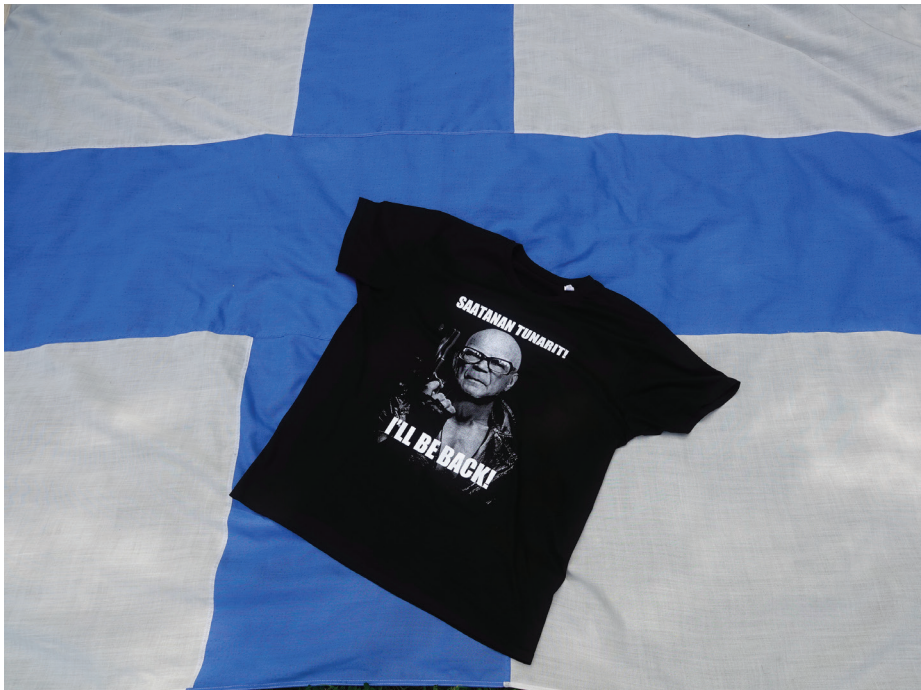
Kuva symboloi Suomen rauhan aikaa, jolloin ulkopolitiikan pelillä oli osajajansa niin, että duunikansankin turvallisuus kehittyi. Suomea ei tarvinnut myydä, ja se on itsenäisyyden ydintä.

Teollisuusliitto on lähtenyt porvaririntaman tukijaksi maamme harastamaa ulkopolitiikkaa myöten, josta se tiedotti alkukesästä. Ammattiliittojen osalta tämä tarkoittaa sitä, että työntekijöiden asemaa ei edes voida puolustaa, vaikka joku vielä haluaisikin. Amerikkalaistamiseen ei kuulu ammatillinen työväenliike; se leimataan kommunistiksi, joka on tuon demokraattisesti nuhteettoman yhteiskuntamallin päädemoni.