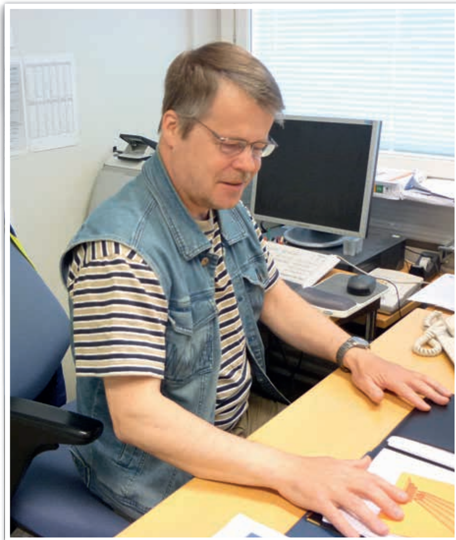
Jotkut vanhoista jutuista hymyilyttävät