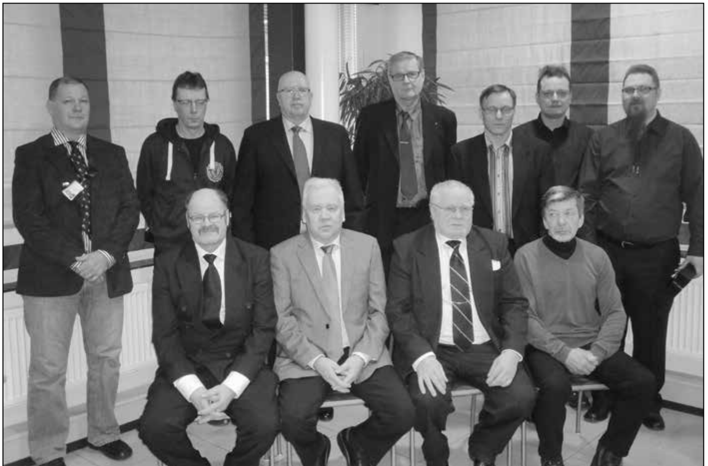
Borealiksen muistamia ammattiosaston jäseniä, jotka olivat paikalla vuosipäiväjuhlassa.