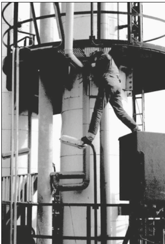
EU:ssa on tahoja, jotka vastustavat turvallisuuden ja terveyden strategista kehittämistä. Kuva vuodelta 1993.

Strategiassa tiedostetaan, että 4000 ihmistä EU:ssa kuolee vuosittain työtapaturmiin ja 160 000 ihmistä työperäisiin sairauksiin, joista enemmistö on syöpiä. Tästä huolimatta strategia uhkaa purkaa työterveyden ja -turvallisuuden sääntelyä vedoten lainsäädännön yksinkertaistamiseen ja pk-yritysten aseman helpottamiseen.