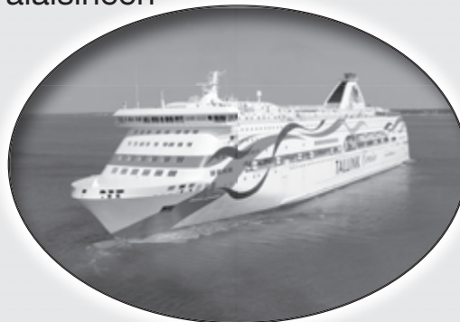
Laivaston nuori kuningatar

Ammattiosasto on varannut 60 hengelle risteilyn Baltic Queen alukselta (30 kpl, B-luokka 2 hengelle)