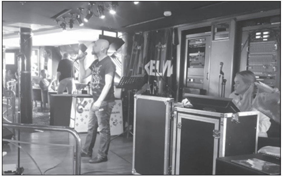
Kesäpäiväristeily on hyvä tilaisuus harjoitella karaokea