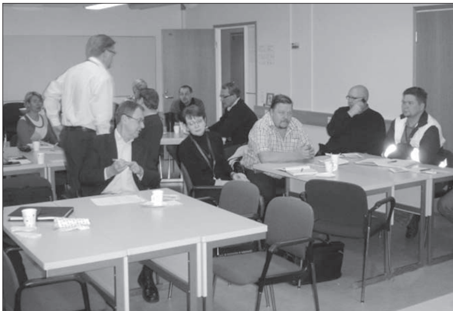
Yhtiön yt-tilaisuus 1.12.2009