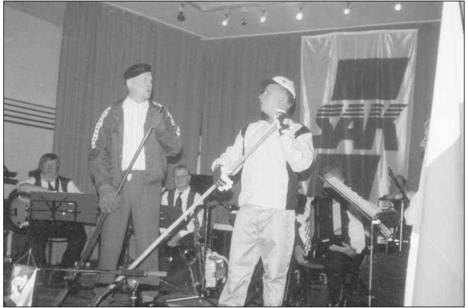
Porvoon Teatteri kutkutti juhlayleisön nauruhermoja

Maailma on muuttunut, mutta työn ja pääoman väliset ristiriidat ovat pysyttäneet paikallisjärjestön tarpeellisuuden. Tehtäväalue on laajentunut, mutta perustehtävä on sama ja ammattiosastojen yhteistyötä on pystyttävä tiivistämään en-