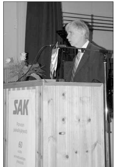
Tilaisuuden juhlapuheenvuoron käyttänyt ulkoministeri Erkki Tuomioja puhui hyvinvointiyhteiskunnan puolesta.