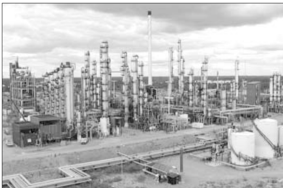
Fenoli- ja aromaattituotanto, kiinteä osa Hub Finlandia jatkossakin

Laitosten tila on yleensä ottaen hyvä, mutta on joitakin laitoksia jotka joko ovat tai ovat käymässä kilpailukyvyttömiksi. Tietääkseni tämä ei koske Porvoota, ottaen silti huomioon sen, mikä on LD:n asema pitkällä aikavälillä teknologiastategiassa.