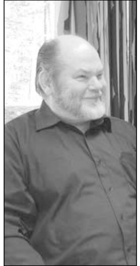
Ammattiosaston puheenjohtaja hauskuutti kommenteillaan osallistujia

Harvassa yrityksessä ihan työntekijätasollakin on yhtä hyvät osallistumisen mahdollisuudet kuin on Borealiksessa. Silti, - erityisesti meillä Suomessa - on osallistumisongelma. Osallistuminen sinällään jo parantaa ilmapiiriä ja se tuo mukanaan epäluulojen väistymistä. Kärjistyneimpänä mukanaoloaonemia näkyy vuorolaisten keskuudessa. Se aiheuttaa myös arvostuksen puutetta, koska sulkeutuneessa horisontissa ei nähdä ulos itsestä. On vain oma työ ja korkeintaan lähimmät kollegat. Kun ei tunne tehtäviä sen kauempana, ei osaa niitä arvostakaan. Niitä on helppo pitää joutavien sukankuluttajien tehtävinä. Vuorovaikutuksen puuttuessa on suuri vaara myös itse jäädä arvostuksen ulkopuolelle.