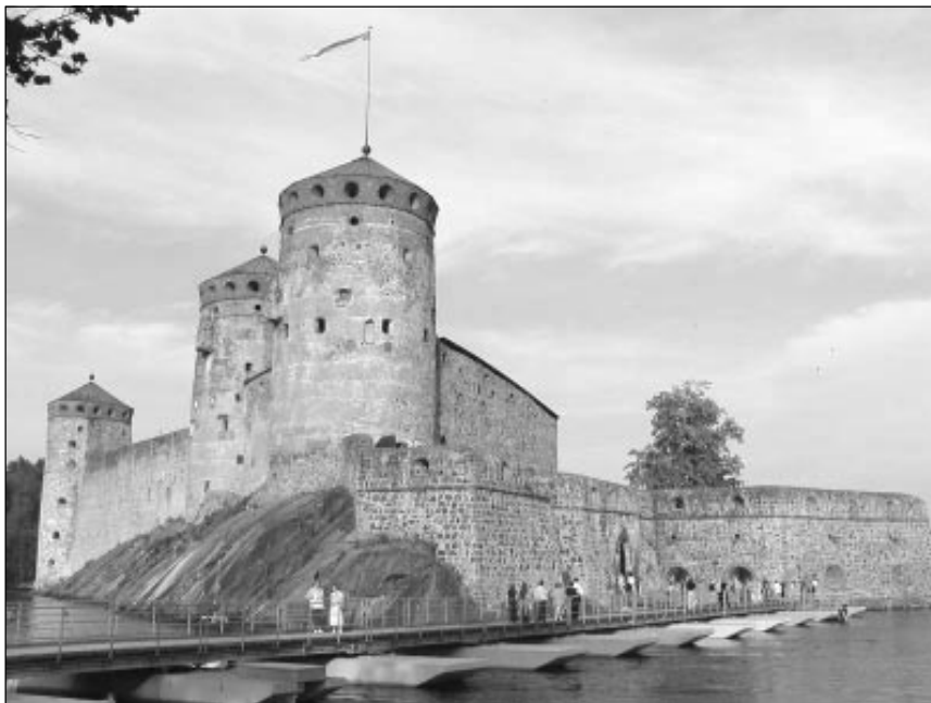
Keskikesän Punkaharjulla ovat Savonlinnan oopperajuhlat käden ulottuvilla.