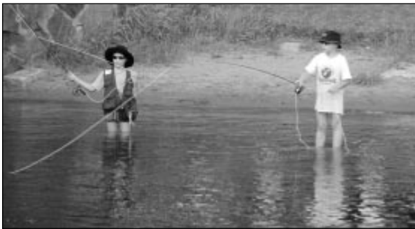
Huolettomuus on harvinaista herkkua. Tarvitsemme siihen lasten esimerkkiä.

Öljy-, maakaasu- ja petrokemian sopimusalan ammattiosastojen yhteistapaaminen jossa ovat olleet edustettuina Porvoon Öljynjalostamon Työntekijät ry, Pekeman Työntekijät ry, Neste Oy:n Työntekijät ry, Maakaasutyöntekijät ry ja Kokemäen Kemiantyöntekijät ry -ammattiosastot.