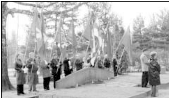
Traditioksi muodostunut kunniakäynti hautausmaalla järjestetään tänäkin vappuna.

Haudalla pitää puheen ay-lakimies Mikko Vartiainen.