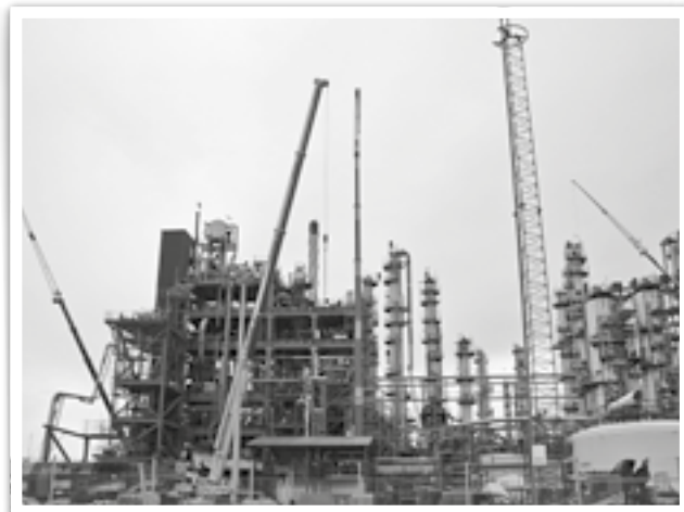
Arkistokuva ARO:n seisokista

Aromaattituotannon seisokkityömaalla pitäisi lehden ilmestyessä olla jo täystohina. Alati muuttuvat koronarajoitukset ovat tuoneet järjestelyyn oman ”kaikki muuttuu koko ajan” –vivahteen. Suomen valtakunnallisen koronastrategian tiedottaminen ja ohjeistus on ollut niin sekavaa, että se on herättänyt