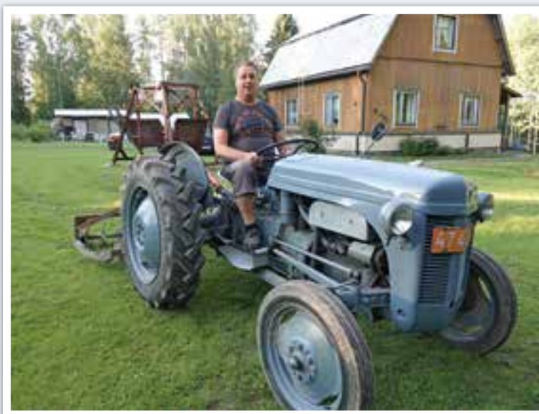
Heinävedellä uusien perunoiden aikaan